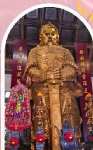
วัดแซกง ขอพรโชคกลาง การเงิน และธุรกิจ