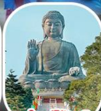
พระใหญ่ไผ่หลิน