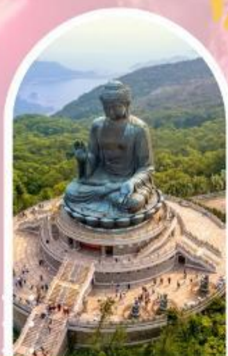
นั่งกระเช้านองปิง นมัสการพระใหญ่ไป่หวลัน